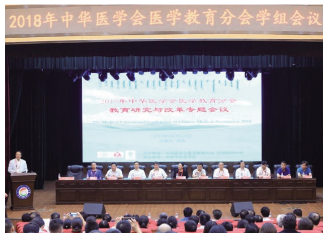
2018年中华医学会医学教育分会在我校召开

学校集各方资源,形成“2+4”医教协同模式,实施医学教育和医疗服务一体化战略,附属医院和第二附属医院全方位深度参与医学人才培养,构建基础医学院、口腔医学院、临床医学院和护理学院四个子模块。医学及医学相关专业包括临床医学、口腔医学、蒙医学、护理学、医学检验技术、药学、口腔医学技术、医学美容技术、中医学等。其中,护理学专业是自治区级品牌专业;口腔医学专业为学校特色专业,2011年作为全国唯一免检专业顺利通过教育部本科专业审批,设有口腔临床实训室、口腔临床模拟实训室。基础医学院拥有“遗传病的分子机理与基因诊断研究创新团队”、“内蒙古人类遗传病研究重点实验室”、“药理学重点实验室”、“机能学实验室”、“数码互动中心”、“人体生命馆”、“中医药馆”等实验实训场所,教学仪器设备值达2000余万元,为各专业的蓬勃发展提供了强有力的支撑和重要保障。赤峰学院附属医院(三级甲等医院)设有“国家医学考试中心医师资格考试实践技能考试与考官培训基地”、“内蒙古自治区普通高等医学教育临床教学基地”和“自治区全科医生临床培训基地”;第二附属医院(三级肿瘤专科医院)是一所集医疗、科研、预防、保健、教学为一体的蒙东地区首家现代化肿瘤专科医院;两所附属医院为临床医学教育提供了完善的实践教学平台。