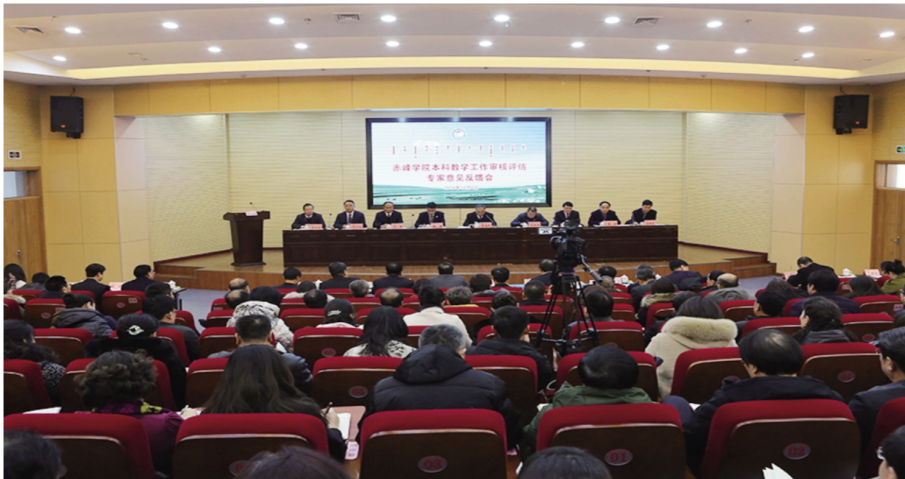
教育部本科教学工作审核评估专家组向我校反馈评估意见