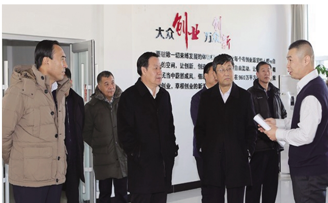
内蒙古自治区党委宣传部副部长高文鸿在大学生创业孵化基地