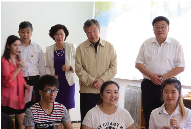
全国政协副主席卢展工来我校视察指导工作