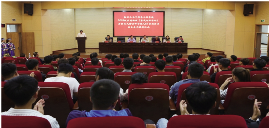
我校举行与青岛青软实训教育科技股份有限公司校企合作揭牌仪式

学校不断扩大对外交流与合作,积极探索校校、校地、校企合作等开放办学方式,尤其是注重构建以产教融合为新常态的合作育人模式,进一步增强了办学活力和办学实力,有效提高了人才培养质量和学生就业质量。在校地合作方面,学校不但与赤峰工业职业