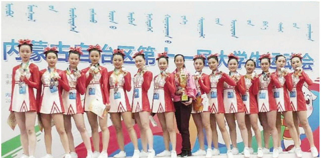
我校健美操代表队喜获内蒙古自治区第十一届大学生运动会亚军