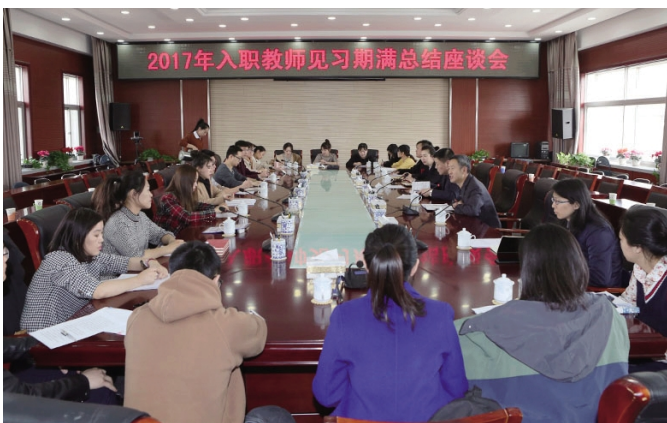
入职教师见习期满总结座谈会

学校现有专任教师 1078 人,其中具有正高级专业技术职务 160 人,副高级专业技术职务 431 人,博士 163 人,具有硕士学位 535 人,国务院特殊津贴专家 4 人,自治区有突出贡献的中青年专家 3 人,自治区“321 人才工程”第一、二层次人选 7 人,“111”人才工程人选 1 人,自治区教学名师 9 人,自治区优秀教师 3 人,自治区教坛新秀 5 人,自治区青年创新人才——“草原英才:工程入选第一层次 2 人,赤峰市“十百千学术技术带头人” 4 人,草原英才团队 2 个。