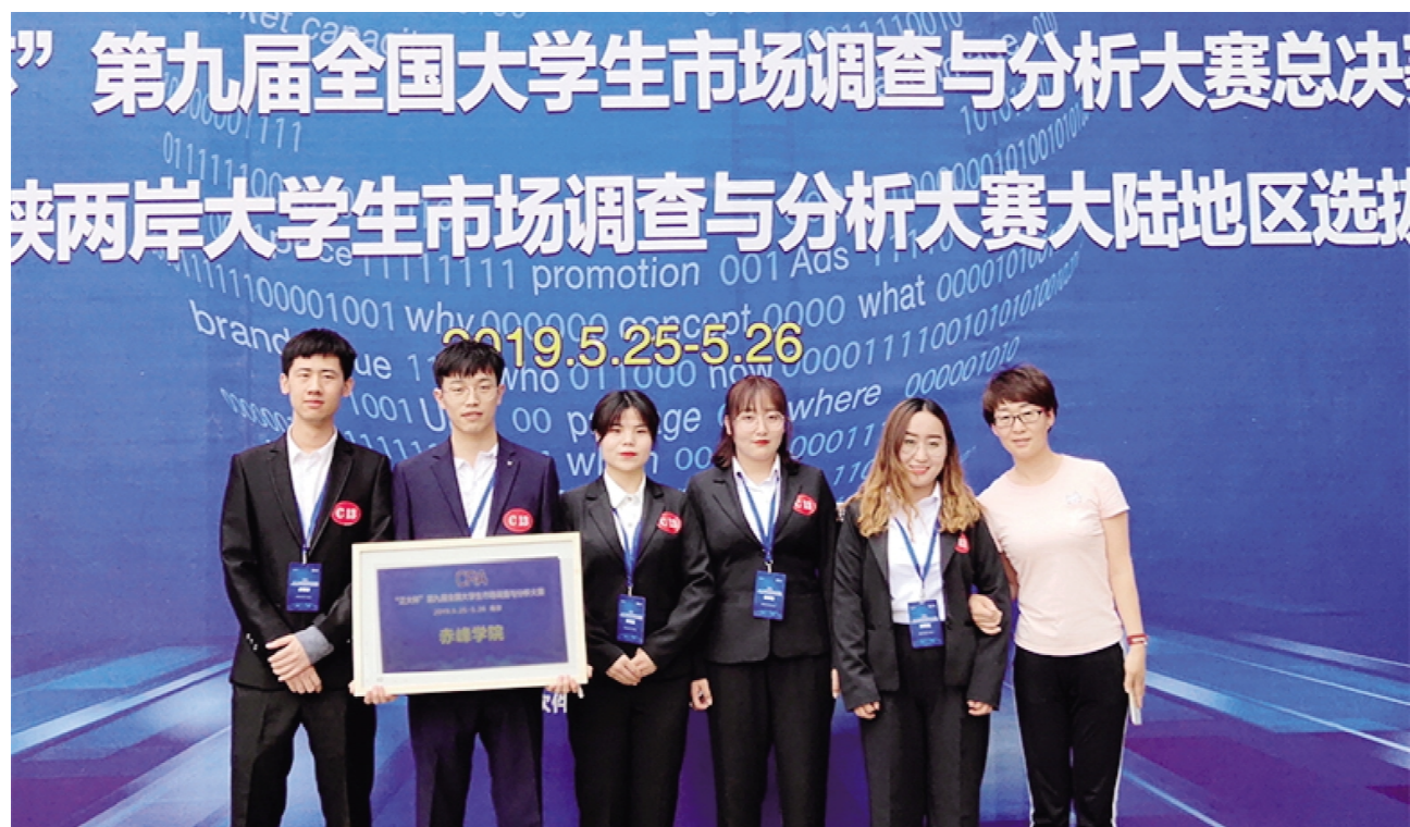
我校师生在第九届全国大学生市场调查与分析大赛总决赛暨第八届海峡两岸大学生市场调查与分析大赛大陆地区选拔赛喜获二等奖