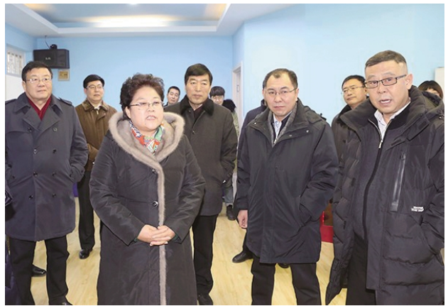
内蒙古自治区政府副主席艾丽华在学前教育与特殊教育学院特殊教育专业实验室调研