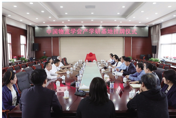
中国物流学会产学研基地在我校揭牌成立