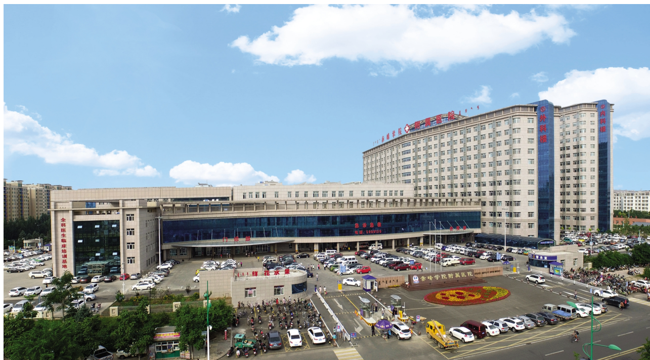
赤峰学院附属医院