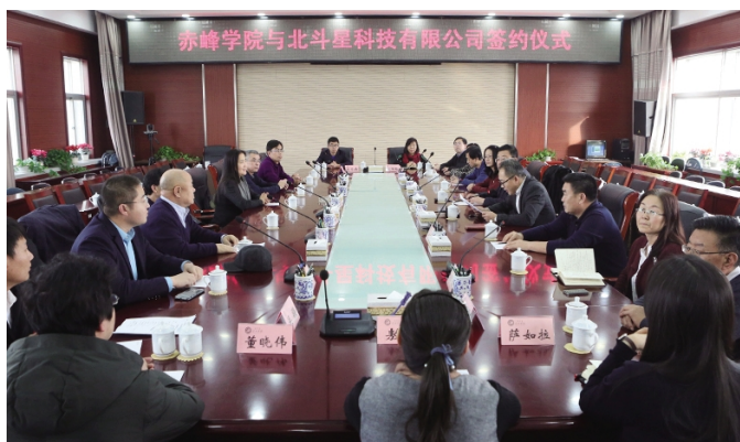
我校举行与内蒙古北斗星科技有限公司合作共建“农业产业信息化、农业大数据平台”签约仪式

根据区域经济社会发展需要,我校开设了部分应用类专业,主要包括会计学、旅游管理、物流管理、应用物理学、电子信息工程、应用化学、化学工程与工艺、应用生物科学、生物技术、土木工程、建筑环境与能源应用工程、资源勘查工程、人文地理与城乡规划、应用统计学、计算机科学与技术、信息与计算科学、应用心理学、考古学、电子商务、文物保护技术、日语和法学等。为切实提高学生的应用能力和实践能力,学校积极推进应用型人才培养模式改革,推动校地、校企、校际合作办学,加强实验、实训、实习和社会实践环节,促进专业与职业融通,努力提高应用型人才的动脑动手能力,实现专业对口的高端就业。