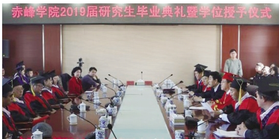
赤峰学院 2019 届硕士研究生毕业典礼暨学位授予仪式