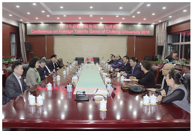
我校举行 2018 年度引进外国人才签约仪式