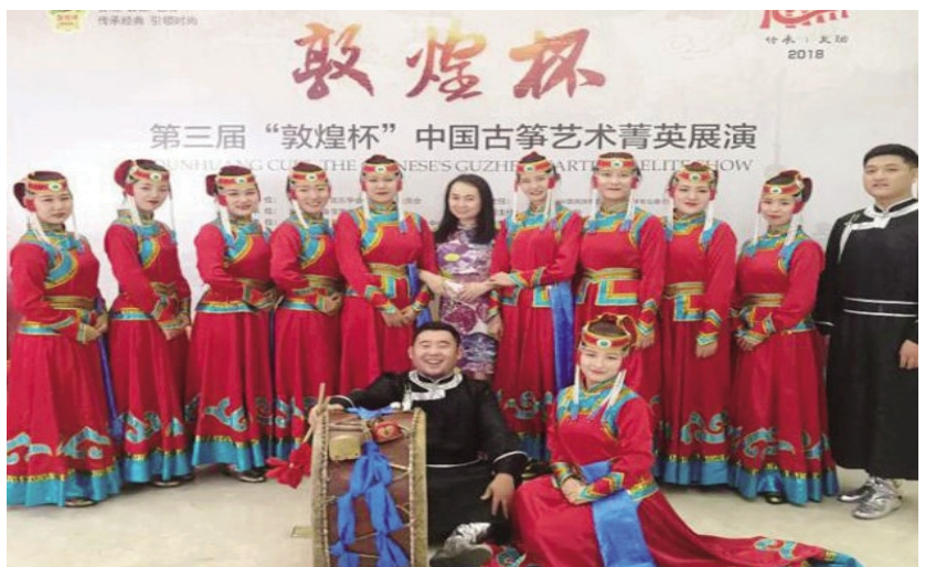
我校音乐学院学生喜获第三届“敦煌杯”中国古筝艺术菁英活动暨“敦煌杯”古筝比赛重奏组金奖

我校艺体类专业主要包括音乐学、音乐表演、舞蹈表演、美术学、工艺美术、视觉传达设计、环境设计、广播电视编导、体育教育、社会体育指导与管理、运动训练(足球方向)等,门类齐全,特色鲜明,在全区具有广泛影响力。音乐学院设有声乐、器乐、钢琴、舞蹈、音乐理论、艺术实践、等六个教研室,拥有数码钢琴教室、MIDI 音乐教室、音乐制作中心等现代化教学设施,学院教师在国内音乐大赛中多次获奖,学生经常参加各种演出实践活动,受到广泛的赞誉。美术学院设有中国画、油画、版画、雕塑、陶艺、蒙古族刺绣与服饰、蒙古族木艺、室内设计、平面设计、影视动画等专业方向。师资力量雄厚,现有国务院特殊津贴专家 2 人,中国工艺美术大师 1 人,中国美术家协会会员 6 人。文学院广播电视编导专业建有摄影摄像灯光实验室、专业录音棚、热光源演播实验室、冷光源演播实验室和采编实验室、和非线性编辑、动画两个专业机房。体育学院拥有蓝排球馆、健体馆、标准塑胶田径场地等教学场地,是内蒙古体育社会科学研究基地,内蒙古自治区 D 级教练员、裁判员培训基地,毗邻的赤峰市体育中心有效改善了体育学院的教学条件,体育人才培养水平不断提升。