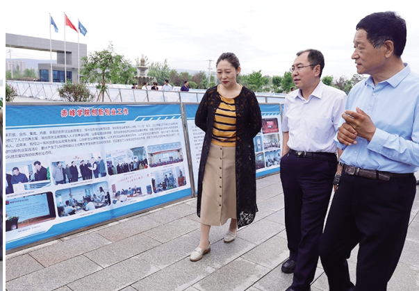
市人大常委会副主任闫辉、市政府副市长生效友参观我校部分学生创业项目参展 2019 年全国大众创业万众创新活动周内蒙古赤峰分会场“双创”成果展