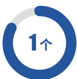
全国科普教育基地

包括自治区重点实验室 4 个（内蒙古自治区高压相功能材料重点实验室、内蒙古自治区光电功能材料重点实验室、内蒙古人类遗传病研究重点实验室、内蒙古口腔颌面疾病研究重点实验室）、自治区社科研究基地 13 个（红山文化暨契丹辽文化研究基地、蒙东城市群建设研究中心、内蒙古体育社会科学研究基地、内蒙古自治区教育创新科研实验培育基地、内蒙古社会科学普及基地、内蒙古自治区特殊教育研究中心、红山文化研究基地、红山文化与中华民族共同体研究基地、内蒙古社会科学院赤峰分院、内蒙古察哈尔文化研究协同创新中心、中华早期文明研究课题机制、红山文化与中华早期文明协同创新中心、内蒙古自治区传统美术类非物质文化遗产研究基地）、自治区级科普基地 6 个（赤峰学院法律诊所、赤峰学院物理世界科普基地、赤峰学院人体生命科学馆、赤峰学院人工智能创意科普示范基地、赤峰学院土传病害生物防治科普教育基地、赤峰学院中医药馆）、自治区级国际科技合作基地 1 个（赤峰学院国际科技合作基地）、自治区级青少年科普研学基地 5 个（赤峰学院人体生命科学馆青少年科普研学基地、赤峰学院人工智能青少年科普研学基地、赤峰学院中医药馆青少年科普研学基地、赤峰学院人类遗传探秘青少年科普研学基地、赤峰学院运动与健康青少年科普研学基地）；赤峰市级研究机构 3 个（赤峰市数字经济与绿色发展研究中心、赤峰市口腔颌面疾病研究重点实验室、赤峰市乡村振兴研究院）、共建研究机构 1 个（中国物流学会产学研基地）。