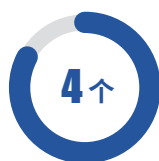
自治区重点实验室