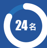
自治区级 人才教师