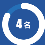
"国务院特殊津贴" 专家