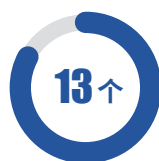
自治区社科研究 基地