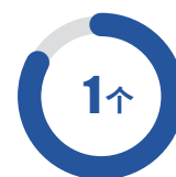
自治区级国际科技 合作基地