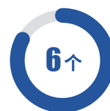
自治区级科普基地