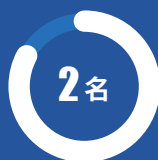
国家专业教学指导 委员会委员